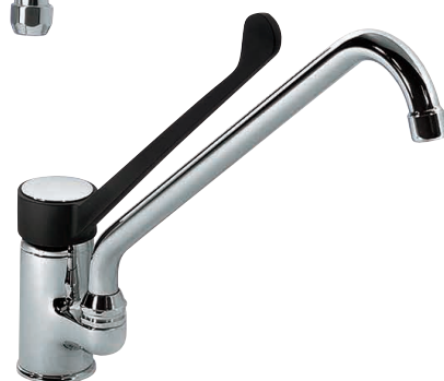
GK MM o GK MM25 o GK