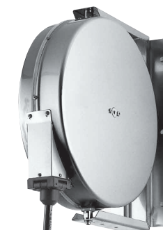
GK MAX 10 y 15