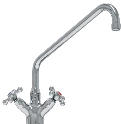
GK S30F o GK S35F