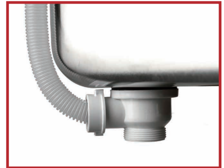
Cubeta con rebosadero